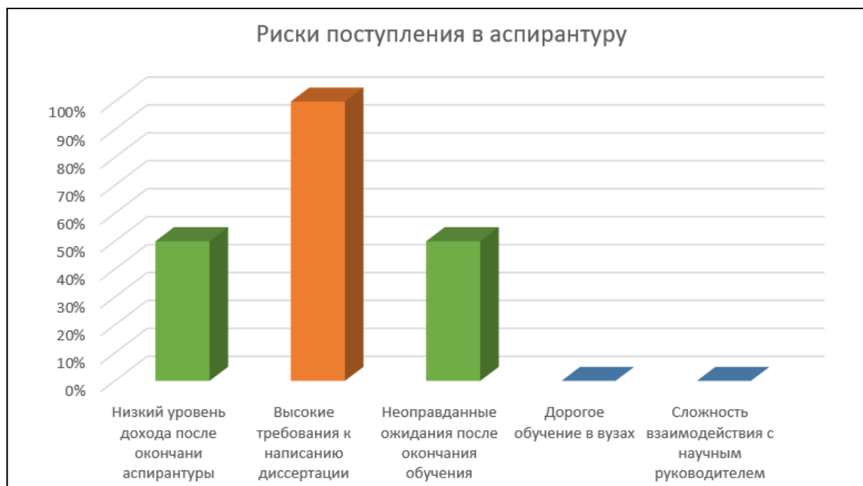
Рисунок 3. Риски поступления в аспирантуру

недостаточного финансового обеспечения, потому что они мало осведомлены о финансовой помощи государства (грантах, государственных заказах). Также в нынешней нестабильной мировой ситуации остро стоит вопрос о требованиях к написанию диссертационной работы, публикации научных работ в международных журналах и т.д. Такая нестабильность отрицательно сказывается на развитии научно-исследовательской деятельности. Кроме того, магистранты выделяют неоправданные ожидания после окончания обучения ещё одним определяющим риском, на который они обращают внимание, так как не имеют информации об аспирантских программах и их эффективности.