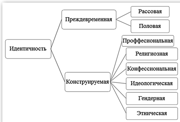
Рисунок 1 — Типология видов идентичности.

Методологическая типология видов идентичности представлена на рисунке 1.